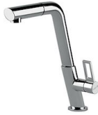
Mitigeur KE 8492 000